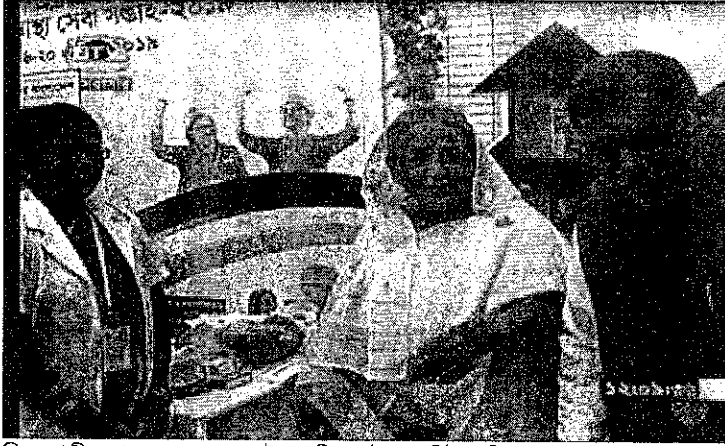
চিত্র: জাতীয় স্বাস্থ্যসেবা সপ্তাহের উদ্বোধনী অনুষ্ঠানে নার্সিং ও মিডওয়াইফারী অধিদপ্তরের স্টল পরিদর্শন করছেন মাননীয় প্রধানমন্ত্রী