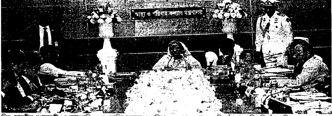
চিত্র: মাননীয় প্রধানমন্ত্রী ২৭ জানুয়ারি ২০১৯ তারিখে স্বাস্থ্য ও পরিবার কল্যাণ মন্ত্রণালয় পরিদর্শনকালে দিকনির্দেশনা দিচ্ছেন

২০১৮-২০১৯ অর্থবছরে স্বাস্থ্য অধিদপ্তরের পরিচালক পদে ১৪জন, উপ-পরিচালক পদে ১৩৩জন, অধ্যাপক পদে ১১৭জন, সহকারী অধ্যাপক পদে ৮৯৬জনকে পদোন্নতি দেয়া হয়েছে। ৩৬তম এবং ৩৭তম বিসিএস পরীক্ষার মাধ্যমে বিসিএস স্বাস্থ্য ক্যাডারে যথাক্রমে ১৮১জন ও ৩০৮জন চিকিৎসক নিয়োগ দেয়া হয়েছে। অধিকন্তু ৩৯তম বিশেষ বিসিএস পরীক্ষার মাধ্যমে বিসিএস (স্বাস্থ্য) ক্যাডারে ৪,৭৯২জন চিকিৎসককে নিয়োগ প্রদানের সুপারিশ করা হয়েছে। স্বাস্থ্য ও পরিবার কল্যাণ মন্ত্রণালয় কর্তৃক ২০১৬ এবং ২০১৮ সালে দুই দফায় যথাক্রমে ৯৫৯৮জন ও ৫০৯২জনসহ মোট ১৪৬৯০জন সিনিয়র স্টাফ নার্স নিয়োগ প্রদান করা হয়েছে। ২০১৮-২০১৯ অর্থ বছরে ৩৫৪জন চিকিৎসক পিআরএল-এ গমন করেছেন। একই সময়ে ১১জন চিকিৎসক কর্মকর্তা স্বেচ্ছায় অবসর গ্রহণ করেছেন এবং ১২ জন চিকিৎসক কর্মকর্তাকে চুক্তিভিত্তিক নিয়োগ দেয়া হয়েছে। বিসিএস (স্বাস্থ্য) ক্যাডার/স্বাস্থ্য সার্ভিসে ১,৩২৫জন চিকিৎসক কর্মকর্তার চাকুরী স্থায়ীকরণ করা হয়েছে।